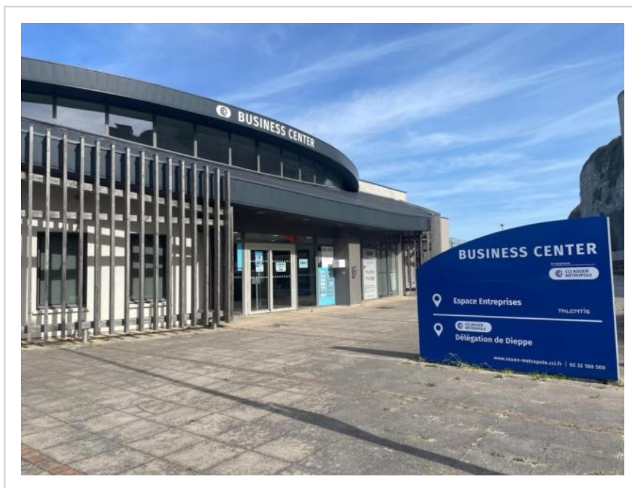
L'évènement se déroule au Business center de la CCI à Dieppe.