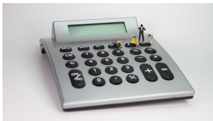
Il y a près de 22 000 TPE et PME en Normandie

Comment se portent nos 22 000 TPE et PME normandes ? Franck Nibeaudo, président de l'Ordre des experts-comptables de Normandie, dresse le bilan de l'année 2025 et évoque les perspectives pour 2026.